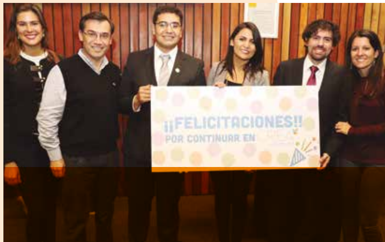
Ganadores del primer desafío programa CREA Salcobrand.

en el primer desafío de innovación del año. Esto quiere decir que casi la mitad de los registrados en la plataforma de innovación aportó una idea.