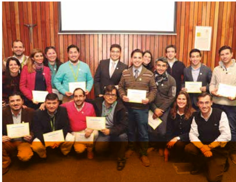
Embajadores de Innovación 2017.

participaron en las tres convocatorias del programa CREA.